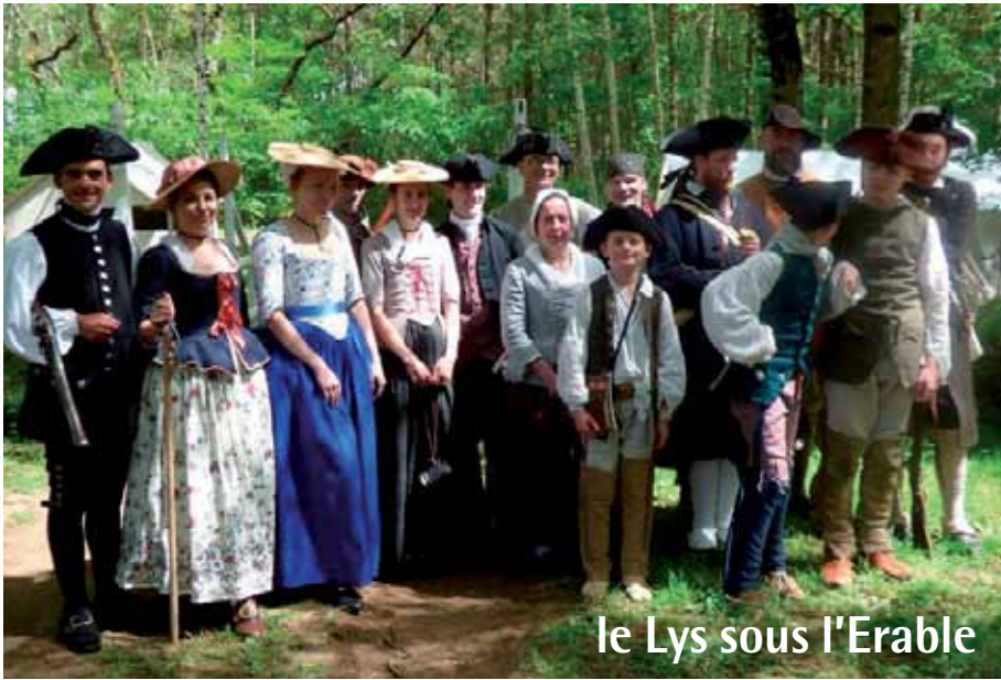
le Lys sous l'Erable