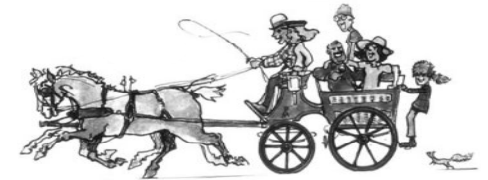
Les attelages de la forêt