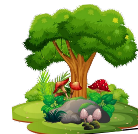
Sortie en forêt

Date limite des inscriptions: Vendredi 26 juin